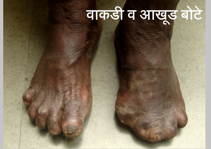
वाकडी व आखूड बोटे

सुरक्षित चप्पल वापरून इजा / जखम व फोड यापासून सुन्नबधिर पायाचे संरक्षण करा, दररोज काळजी घ्या आणि विकृती व विद्रूपता टाळा.