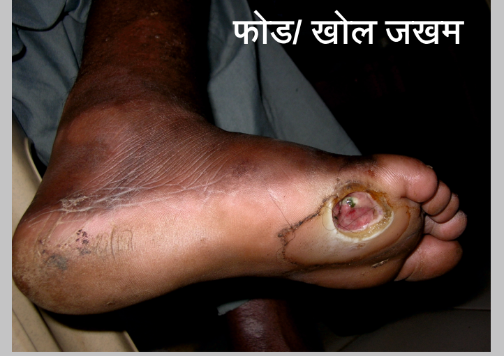
फोड / खोल जखम