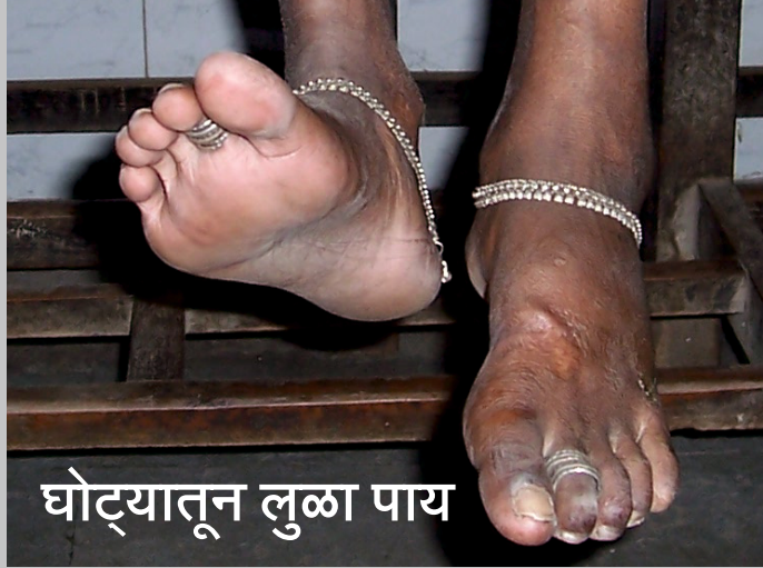
घोट्यातून लुळा पाय