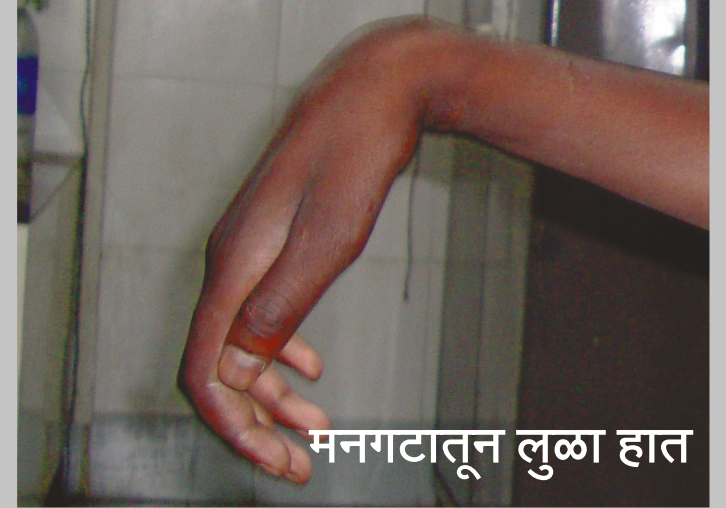
मनगटातून लुळा हात