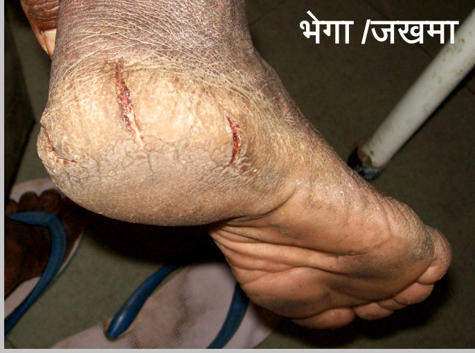
भेगा / जखमा