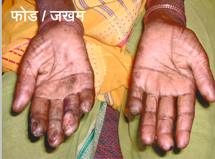
फोड / जखम